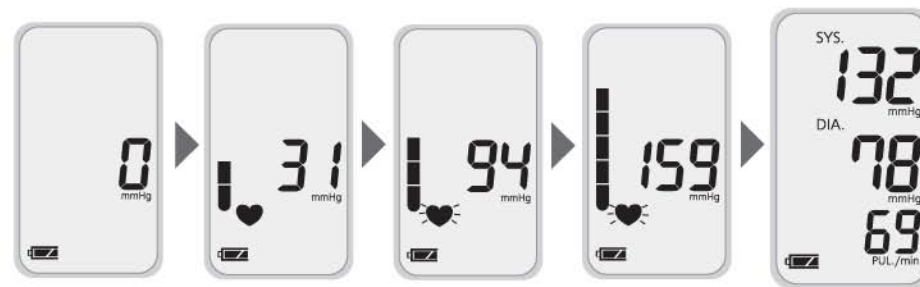
Процесс накачивания манжеты и измерения давления