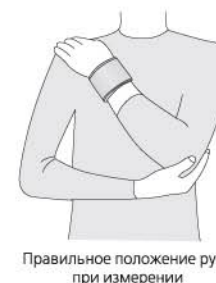
Правильное положение руки при измерении