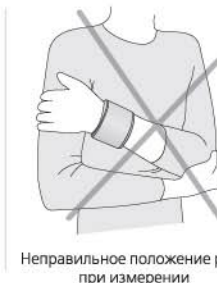
Неправильное положение руки при измерении