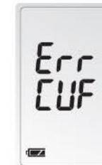
Сообщение о неплотно закреплённой манжете