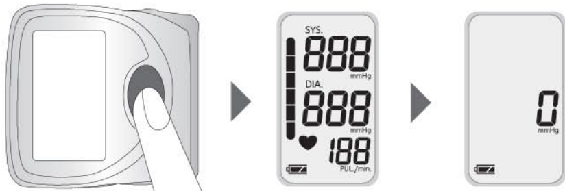
Включите прибор, нажав кнопку START